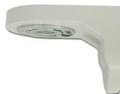
Опция: Монтажный кронштейн STB-C201 для крепления на стену.